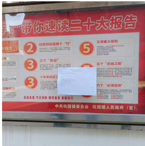
图 2.2-2 坑园镇现场公示照片