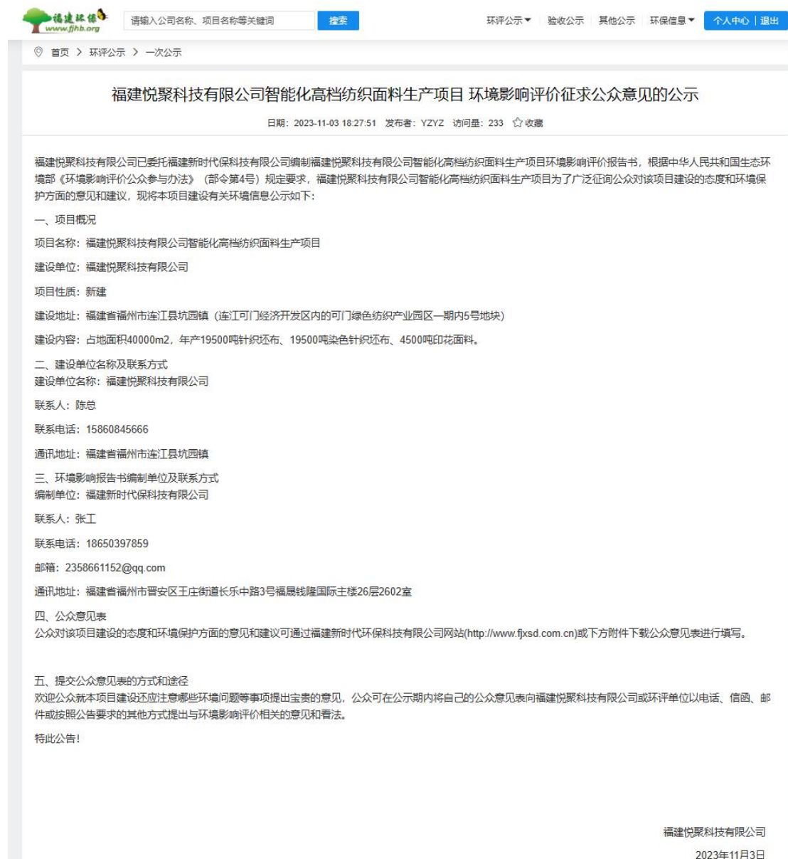
图 2.2-1 首次公示信息截图

首次公示网址： https://www.fjhb.org/huanping/yici/25227.html